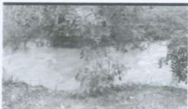
VALETA LATERAL CASA